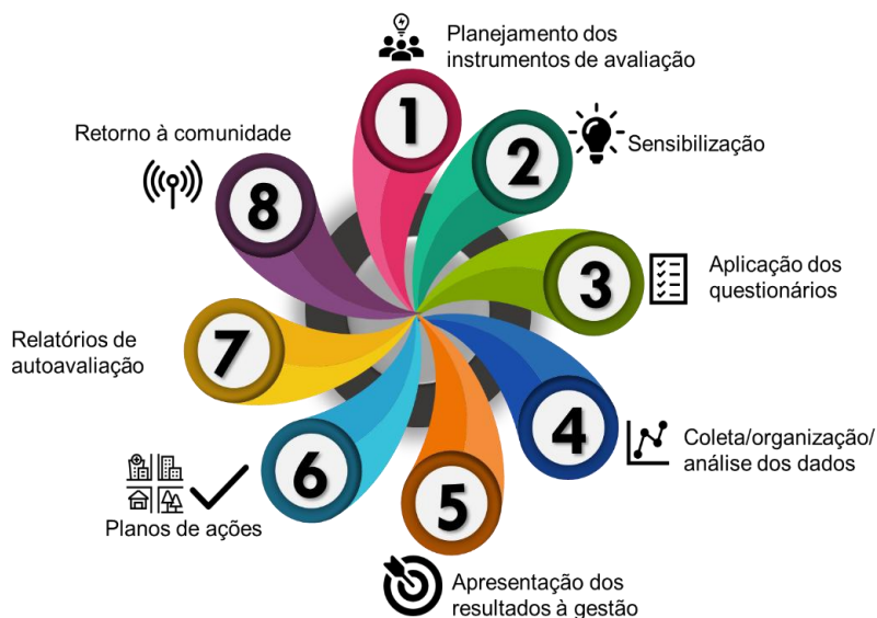
Figura 1 - etapas da autoavaliação

Abaixo apresenta-se como a CPA/Núcleo de autoavaliação no IFFar, organiza o ciclo de autoavaliação: