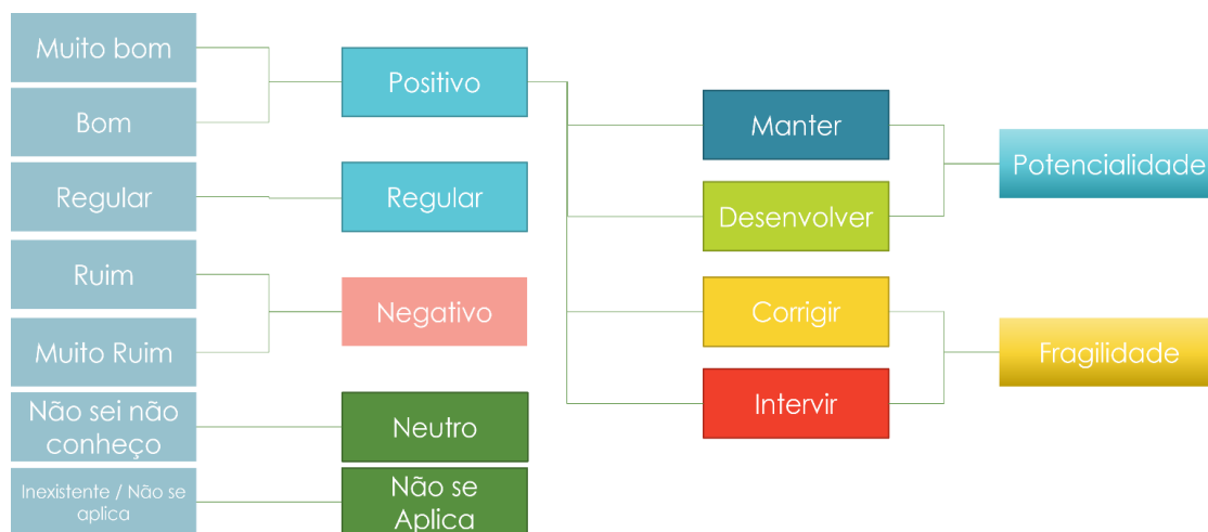
Figura 2: Indicadores de Avaliação