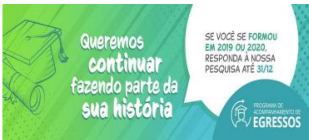
Figura 1. Banner utilizado nas campanhas do Programa de Acompanhamento de egressos do IFFAR.