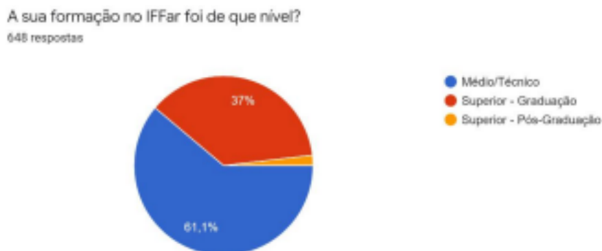
Figura 3 - Percentual de respondente por nível de ensino

participantes), enquanto 37% (240 deles) são oriundos de cursos superiores e 1,9% da Pós-Graduação (12 respondentes).