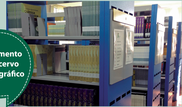
Incremento do acervo bibliográfico