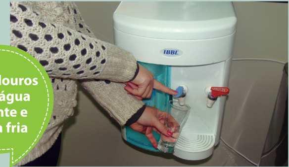
Bebedouros com água quente e água fria