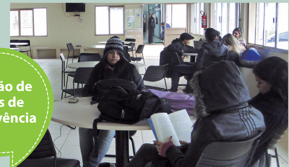
Criação de salas de convivência

Os processos de autoavaliação ocorrem anualmente. Participe e contribua para que mais ações sejam realizadas.