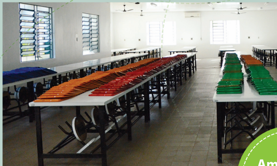
Ampliação de Refeitórios