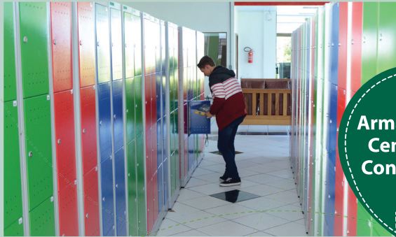
Armários nos Centros de Convivência