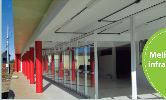
Melhorias na infraestrutura