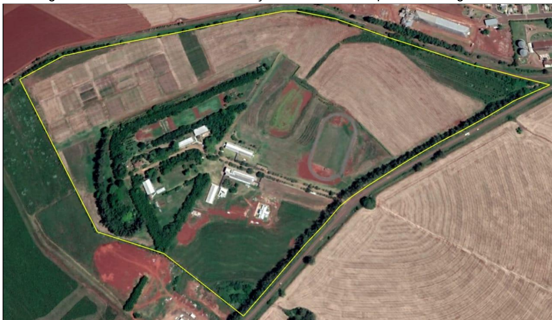
Imagem 4: Vista aérea sobre a delimitação da área do Campus Santo Ângelo.