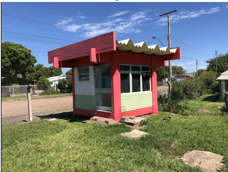
Fotos 39 e 40 - Vista Diagonal Externa da Guarita e do Banheiro Campus Avançado de Uruguaiana.