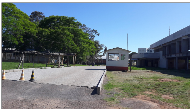
Fotos 03 e 04 - Vista Frontal e 3/4 da Guarita da Entrada Secundária do Campus Alegrete.