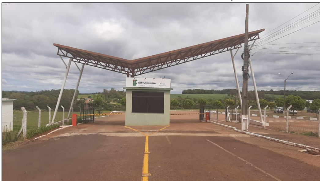
Foto 09 - Vista Frontal do acesso à Guarita do Campus Panambi.