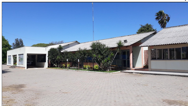
Fotos 05 e 06 - Visão da Entrada Principal e Vista Frontal do Prédio das Salas de Aulas.