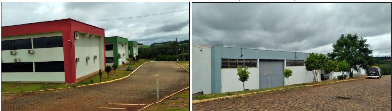
Fotos 13 e 14 - Visão das ruas laterais dos prédios do campus.