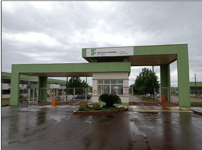
Fotos 17 e 18 - Vista Frontal da Guarita e Visão Interna do Local de Trabalho do Campus Santa Rosa.