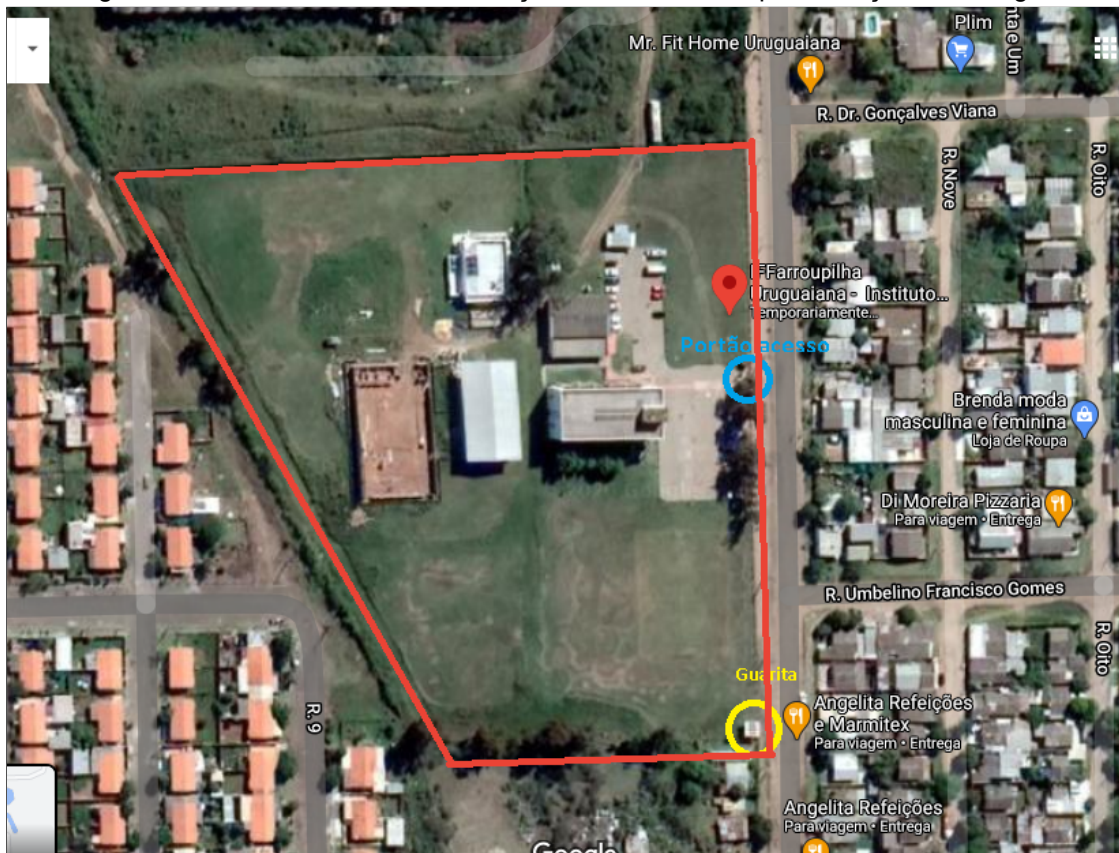
Imagem 6: Vista aérea sobre a delimitação da área do Campus Avançado de Uruguaiana.