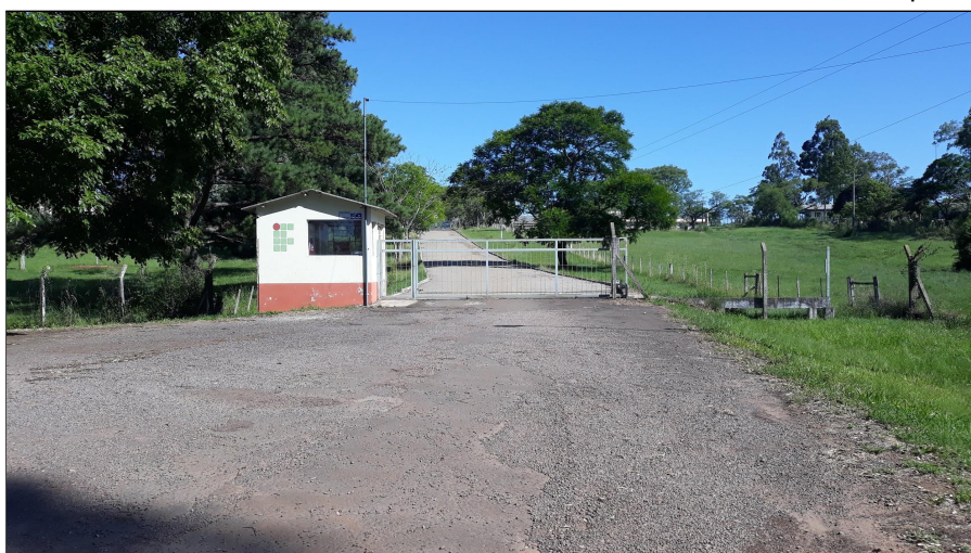
Fotos 01 e 02 - Vista Frontal da Guarita da Entrada Principal e Interna do Campus Alegrete.