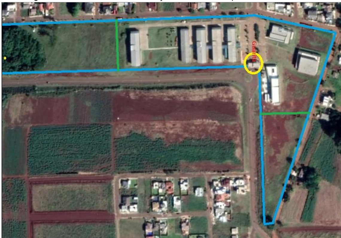
Imagem 3: Vista aérea sobre a delimitação da área do Campus Santa Rosa.