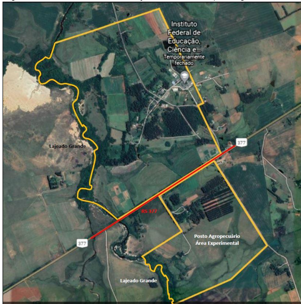
Imagem 1: Vista aérea sobre a delimitação da área do Campus Alegrete.